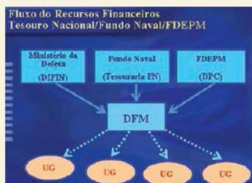
Figura 1 – Fluxo dos Recursos Financeiros