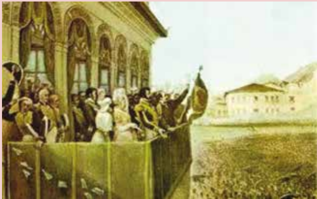
Figura 3 - Aclamação de D. Pedro I, Imperador do Brasil, no Campo de Santana, Rio de Janeiro. Jean-Baptiste Debret (1768-1848).

objetivava a volta do Rei D. João VI. O ápice deste movimento foi a chamada Revolução Liberal do Porto (1820), que culminou na volta do Rei no ano seguinte.