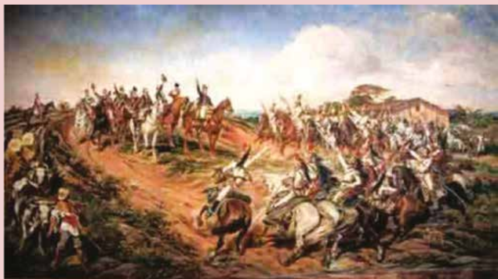
Figura 4 - Quadro “Independência ou morte”, de Pedro Américo de Figueiredo e Melo, 1888.

Devido a estes acontecimentos, eclodiram em todo o território nacional reações de tropas portuguesas. Na Bahia, o General português Madeira de Melo encabeçava a resistência, a qual foi derrotada em 2 de julho de 1823 pelo destacamento de Artilheiros Marinheiros que desembarcaram no local. Entretanto, os ancestrais do CFN também atuaram contra o próprio povo brasileiro em diversos acontecimentos históricos, a mando do Imperador. Dentre estes acontecimentos, destacam-se os desembarques no Recife, sob o comando dos Capitães-de-Mar-e-Guerra ingleses John Taylor e James Northon, para sufocar as revoltas que lutavam contra as medidas autoritárias de D. Pedro I, conhecidas como “Confederação do Equador”.