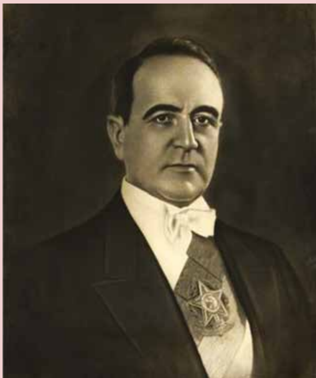
Figura 9 - Getúlio Dornelles Vargas (1882-1954). Presidente do Brasil de 1930 a 1945 e de 1951 a 1954