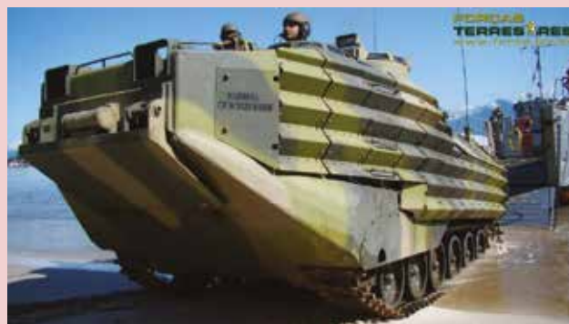
Figura 12 - Desembarque de tropas anfíbias do Corpo de Fuzileiros Navais em exercício. Reprodução

Destaca-se a atuação do patrono do CFN, o Almirante Sylvio de Camargo, que foi fundamental para a criação de um Quadro de Oficiais do CFN, até então inexistente, no ano de 1932, quando o referido Oficial foi transferido do Corpo da Armada para o de Fuzileiros Navais, após várias contribuições referentes ao aumento do nível de escolaridade e preparo profissional da tropa. Foi importante também nas décadas de 40 e 50, fazendo com que os fuzileiros alcançassem alguns requisitos imprescindíveis para seu crescimento. Assim, o Corpo de Fuzileiros Navais mostrou-se sempre como uma tropa coesa, determinada e audaz, buscando o constante aprimoramento das atividades navais e o engrandecimento da Instituição, a Marinha do Brasil.