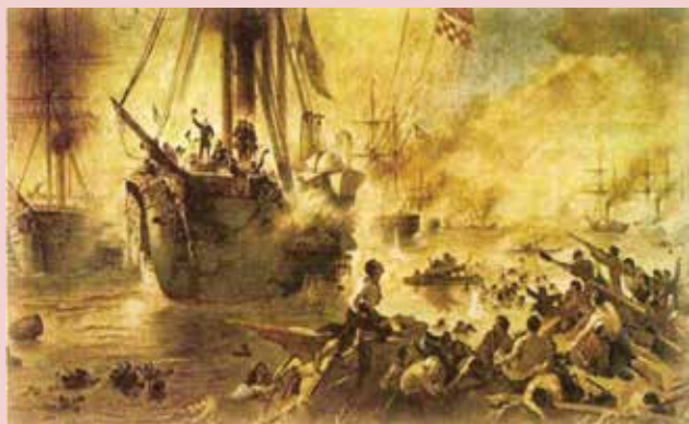
Figura 5 - Batalha Naval do Riachuelo, de Pedro Américo de Figueiredo e Melo (1843-1905).

O emprego do atual Corpo de Fuzileiros Navais antes da Guerra do Paraguai foi de suma importância, com destaque para as intervenções Platinas na Campanha contra Oribe e Rosas e a Guerra contra Aguirre. Neste contexto, vale destacar que, em 24 de novembro de 1852, por intermédio do Decreto nº 1067, a Brigada de Artilharia da Marinha passou a ser chamada de Batalhão Naval, com efetivo fixo de 64 Oficiais e 1216 Praças, organizado em seis Companhias de Infantaria e duas de Artilharia.