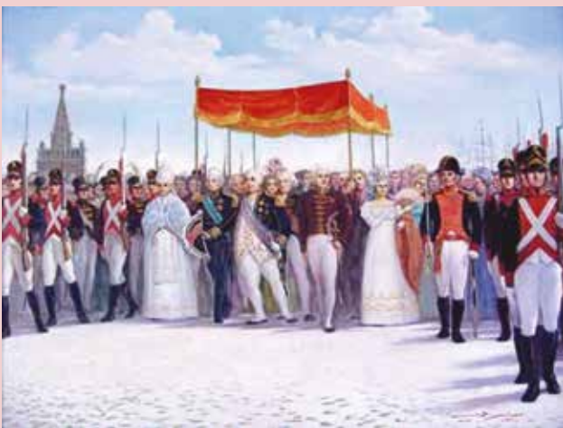
Figura 2 - Chegada da família real ao Brasil

No início do século XIX, o mundo presenciou o poder grandioso do Império Francês, liderado pelo grande militar Napoleão Bonaparte, o qual, devido à resistência do Império Britânico, decidiu decretar uma restrição aos governos europeus, que, a partir daquele momento, estariam proibidos de manter qualquer relação comercial e diplomática com a Inglaterra. Tal