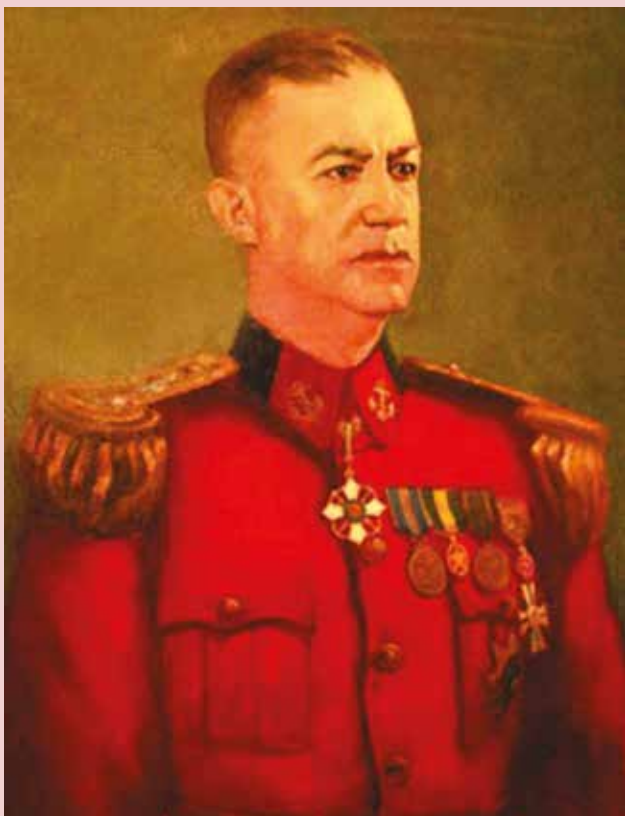
Figura 11 - Almirante (FN) Sylvio de Camargo. Reprodução

A aparição dos Fuzileiros Navais neste momento histórico esteve basicamente relacionada à contenção de atos políticos que visavam à implementação de um modelo comunista de governo, como as greves portuá-