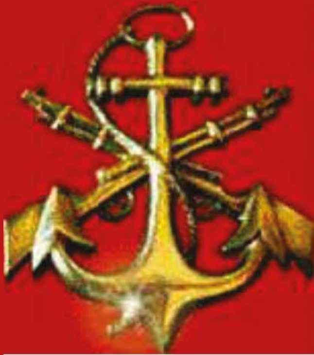
Figura 1- Insígnia do Corpo de Fuzileiros Navais