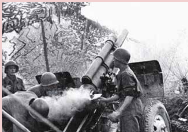
Figura 10 - Artilharia Brasileira na 2ª Guerra Mundial, em 1944. Reprodução

A participação do Corpo de Fuzileiros Navais (na época Regimento Naval) no conflito foi breve, já que naquela altura a Alemanha estava em uma notável decadência, iniciada na quebra do pacto germano-soviético e na abertura de duas frentes de batalha, e a Itália focava nos seus interesses no continente africano. Como consequência dos afundamentos no Atlântico, foi instalado um destacamento de Fuzileiros Navais na Ilha da Trindade, que visava à proteção contra um possível estabelecimento de base de submarinos alemães. Além disso, foram criadas as Companhias Regionais do CFN em Recife, Natal e Salvador, que possuíam ampla jurisdição sobre as águas litorâneas e que, posteriormente, comporiam o Grupamento de Fuzileiros Navais. Vale ressaltar, também, o embarque dos Fuzileiros Navais nos navios da Marinha de Guerra que faziam o patrulhamento da costa, com destaque para o navio-auxiliar “Vital de Oliveira”, que naufragou no dia 19 de julho de 1944, levando para o fundo do Atlântico seis componentes do Regimento Naval.