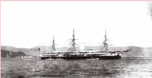
Figura 7 - Encouraçado “Aquidabã”. Reprodução

O movimento que entrou para história do país como Revolta da Armada foi consequência direta de outra revolta que começou no Brasil um pouco antes, a chamada Revolta Federalista. Segundo historiadores, a Revolta da Armada iniciou-se quando um grupo de oficiais, liderados pelo Almirante Custódio de Mello, passou a conspirar contra o presidente devido à prisão do então presidente do Clube Naval, o prestigiado Almirante Wandenkolk.