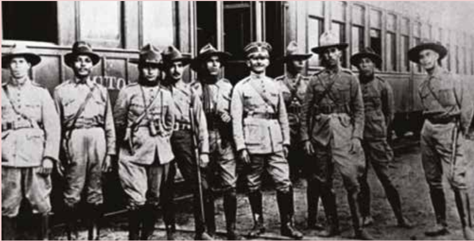
Figura 8 - Movimento Tenentista, que deu origem à Coluna Prestes. Reprodução

que tornava a profissão menos política), consistiu na indignação da jovem oficialidade em relação à hegemonia política e oligárquica, sustentada pelas fraudes eleitorais e apoiada pelos oficiais superiores. Após a prisão do ex-Presidente da República e presidente do Clube Militar, Marechal Hermes da Fonseca, o movimento ganhou corpo e culminou com um clima de insegurança na capital nacional. O atual Corpo de Fuzileiros Navais atuou como força de defesa, deslocando suas companhias para locais estratégicos como o Palácio do Catete e o Quartel-General do Exército. Neste cenário, vale salientar que novamente a Fortaleza da Ilha das Cobras foi atacada.