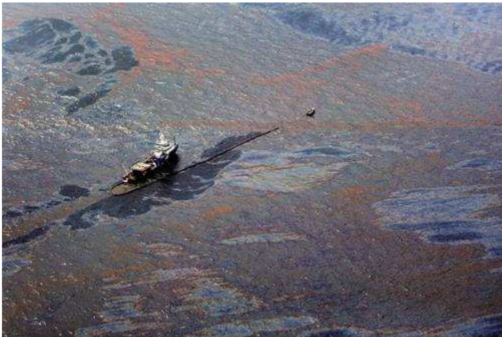
Figura 2 – Poluição por óleo.

A forma de poluição mais visível e comum é a poluição por petróleo e seus derivados, provocada por acidentes com navios petroleiros, oleodutos, lavagem dos tanques, exploração de poços de petróleo no mar, entre outros. O petroleiro pode causar contaminações das águas quando ocorrem vazamentos e após ser feita uma lavagem nos tanques dos navios, onde permaneceram resíduos do produto, e a água com petróleo é lançada no mar (Figura 2). No caso dos oleodutos, podem ocorrer impactos quando o encanamento se rompe.