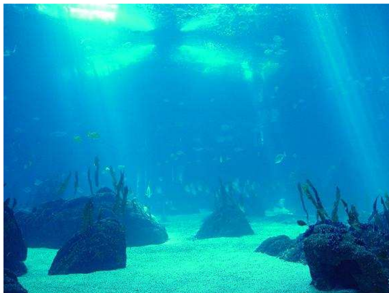
Figura 1 – Oceano.

Os oceanos são importantes para o planeta, visto que neles se originou a vida. Eles são os grandes produtores de oxigênio (cerca de 70% do oxigênio libertado para a atmosfera é produzido pelo fitoplâncton durante o processo fotossintético.), fundamentais para o equilíbrio ecológico do planeta, regulam a temperatura da Terra, interferem na dinâmica atmosférica, caracterizam tipos climáticos, além de abrigarem cerca de 80% das espécies de vida da Terra.