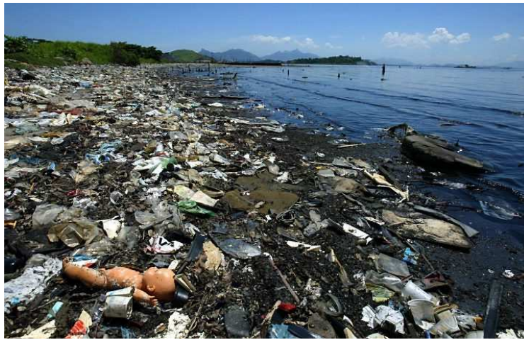
Figura 4 – Lixo acumulado em praia.

Outra forma ameaçadora é a existência de metais e vidros, que podem cortar os animais e causar infecções, às vezes fatais, e a de garrafas ou outros recipientes, que podem aprisionar pequenos animais (Figura 4). Porém, um problema ainda mais preocupante é a presença nos mares de dejetos industriais e lixo hospitalar, pois os hospitais, clínicas e laboratórios produzem grande quantidade de resíduos perigosos, tais como materiais cortantes (bisturis) e frascos de remédios.