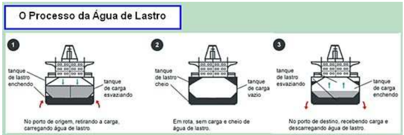
Figura 5 – Processo de água de lastro.

Em alto-mar, um navio sem lastro pode ficar descontrolado, logo a água de lastro compensa essa perda de peso de carga ou até mesmo de combustível, regulando a estabilidade e mantendo a segurança do navio e de sua tripulação.