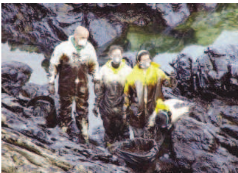
Costa da Escócia (2001)

A identificação inequívoca da fonte de um derrame e a devida responsabilização dos seus autores, atribuição delegada à Marinha do Brasil a partir da promulgação da Lei Federal nº 9966/2000, é consequência de um complexo sistema que precisa funcionar com todas as suas engrenagens ajustadas. Na ocorrência de um evento de poluição por óleo ou seus derivados, a estrutura existente e espalhada por todo o território nacional, composta pelas Capitânicas dos Portos, suas Delegacias e Agências, é acionada para averiguar as circunstâncias do incidente e verificar que embarcações podem ter ocasionado tal episódio. Nessas circunstâncias, quando a fonte é desconhecida, a sua identificação se dá pela coleta de amostras do produto derramado e sua comparação com outras amostras coletadas de fontes