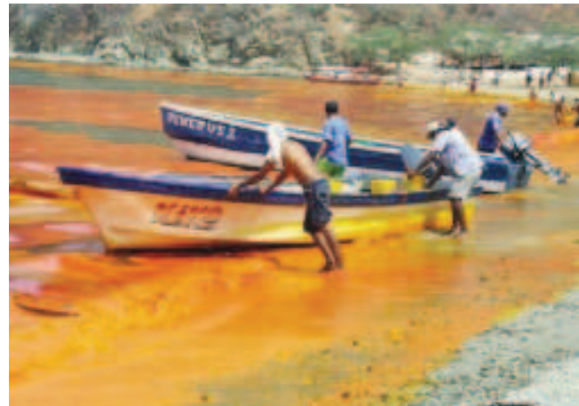
Derrame de óleo na Colômbia (2007)

consideradas suspeitas, como instalações em terra ou embarcações, por meio de análises químicas realizadas em laboratório. A coleta de amostras é a etapa mais importante de todo o processo, requerendo a avaliação adequada do cenário observado, a devida identificação das fontes consideradas suspeitas e a coleta de amostras dessas fontes para subsidiar a investigação. Falhas operacionais nesta etapa da investigação podem comprometer todo o processo, impossibilitando a punição dos responsáveis. Tal situação causa uma série de prejuízos para a credibilidade do sistema implementado, na medida em que denota falta de capacidade de fiscalização por parte do Estado, transmitindo ao infrator e à Sociedade uma sensação de impunidade inadmissível, que acaba sendo um estímulo a novas infrações por parte daqueles indivíduos ou organizações não-comprometidos com o cumprimento da legislação e com a preservação do meio ambiente.