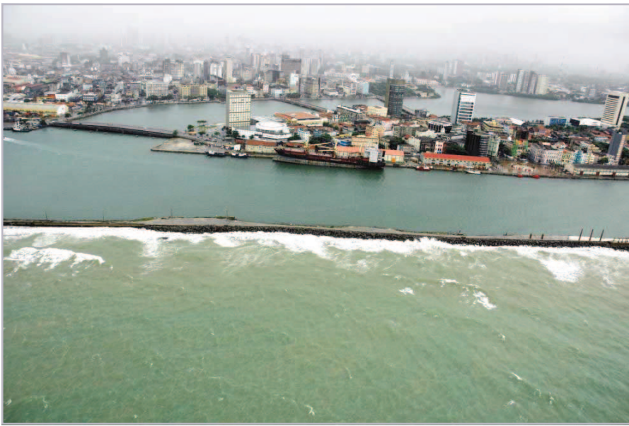
Vista do Porto de Recife / PE

O estudo é concluído indicando que a elevação do nível do mar será da ordem de 3 a 10mm/ano, ou 10-20 cm/século, o que trará conseqüências indesejáveis para países com terras baixas e regiões litorâneas, onde ocorra afundamento, ou subsidência da terra “firme”.