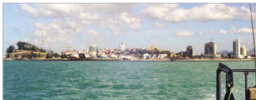
Orla marítima de Macaé / RJ