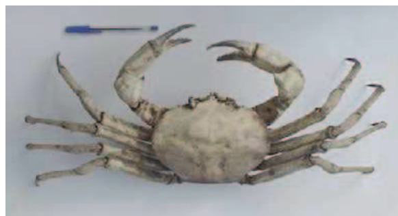
Caranguejo de profundidade

as pargueiras, o batata, ( Lopholatilus villarii ) foi a espécie mais representativa tanto em número (36%) quanto em peso total (50%). As abróteas (n=64), os baiacus ( Sphoeroides spengleri ) (n = 12) e os batatas (n = 10) corresponderam a 80% do número total de peixes capturados.