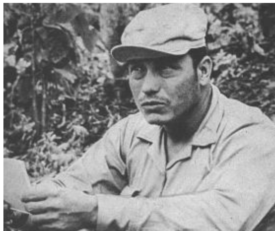
Figura 2 - Manuel Marulanda Vélez, "Tirofijo", fundador das FARC-EP. Fotografia de 1964.