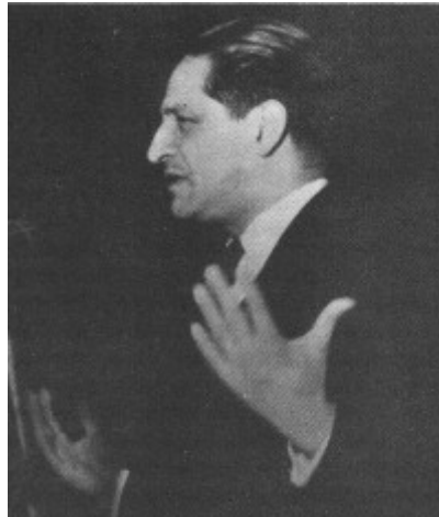
Figura 1 - Jorge Eliécer Gaitán Ayala