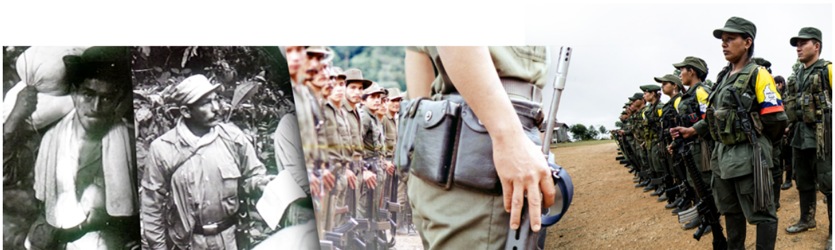
Figura 3 – Evolução das FARC-EP.