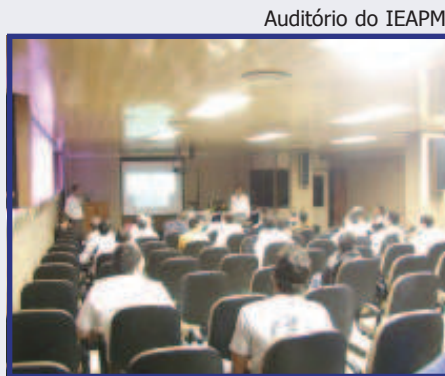
Auditório do IEAPM

O IEAPM desenvolve parceria com algumas instituições públicas e privadas.