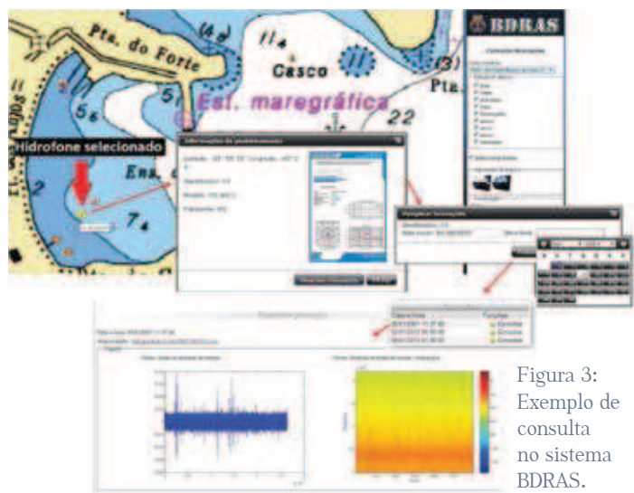
Figura 3: Exemplo de consulta no sistema BDRAS.

No sistema de consulta do BDRAS, a recuperação dos dados para pós-processamento do sinal pode ser realizada direto pela carta náutica, via seleção do ícone do hidrofone e informando-se o período desejado, como mostra a Figura 3.