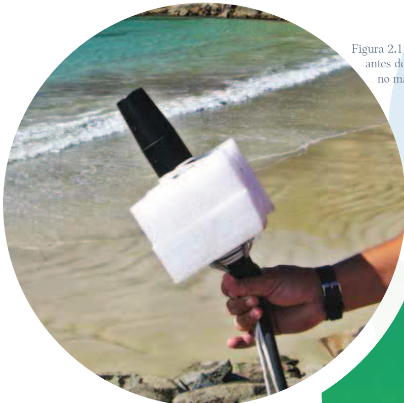
Figura 2.1: Hidrofone antes de ser colocado no mar.