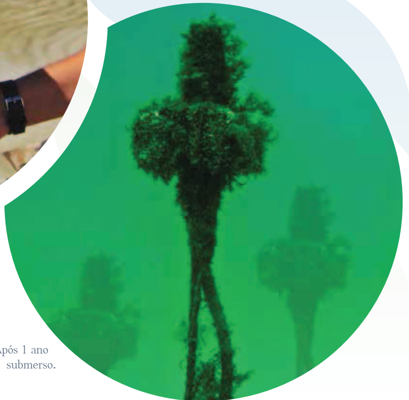
Figura 2.2: Após 1 ano submerso.

farão parte de seu nome no servidor e estarão associados juntamente ao seu posicionamento no banco de dados. Da mesma forma, as figuras associadas às gravações, como: séries temporais e espectrogramas são armazenadas no banco, de modo que numa consulta todos esses dados possam ser visualizados.